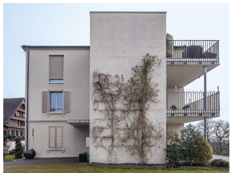
Bild oben: Eine weitere kleine Scheune in bester Aussichtslage wird demnächst durch einen Neubau ersetzt (Hoening Voney Architekten). Bild unten: Doppelhäuser an der Südkante des Weilers (Lengacher Emmenegger 2015).